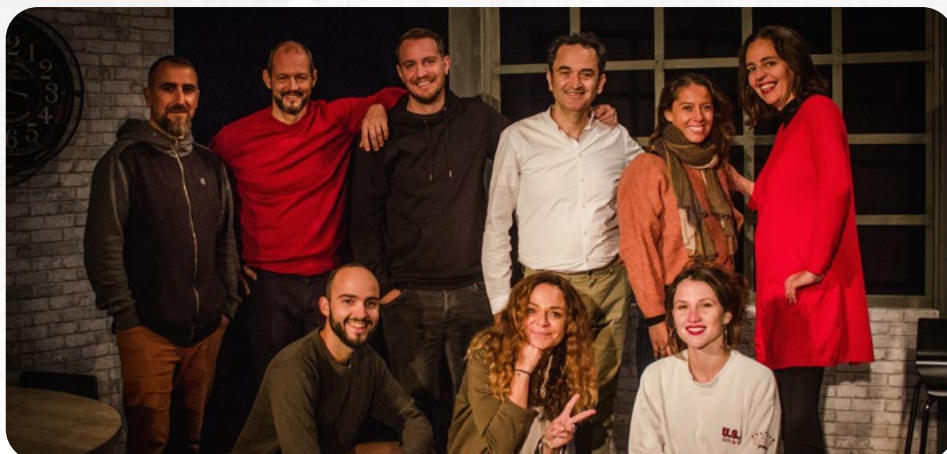
L'équipe de Mon meilleur copain en pleine création

Depuis sa création, la Compagnie Cléante s'engage pour le partage d'un théâtre bienveillant et ouvert à toutes et à tous, dans lequel l'artiste se transcende pour créer une véritable émulation culturelle, sociale et amicale sur son territoire.