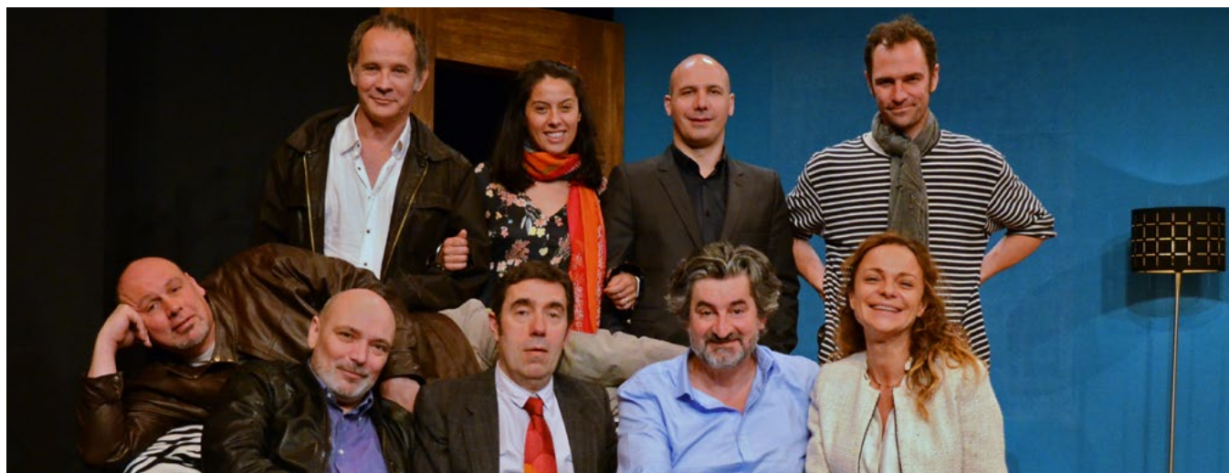
L'équipe lors de la création du Dîner de cons

Depuis sa création, la Compagnie Cléante s'engage pour le partage d'un théâtre bienveillant et ouvert à toutes et à tous, dans lequel l'artiste se transcende pour créer une véritable émulation culturelle, sociale et amicale sur son territoire.