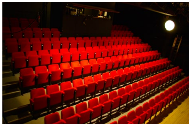
Théâtre Marc Sebbah de Muret

Que ce soit dans ses créations ou pour la programmation, la compagnie Cléante met un point d'honneur à proposer au public un théâtre accessible à tous, varié et de qualité . Ce-dernier s'en réjouit puisqu'il vient toujours plus nombreux, année après année .