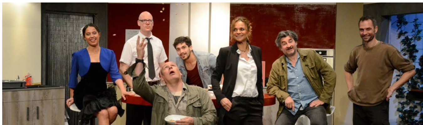
L'équipe de la création Cuisine et dépendances

Que ce soit dans ses créations ou pour la programmation, la compagnie Cléante met un point d'honneur à proposer au public un théâtre accessible à tous, varié et de qualité . Ce-dernier s'en réjouit puisqu'il vient toujours plus nombreux, année après année .